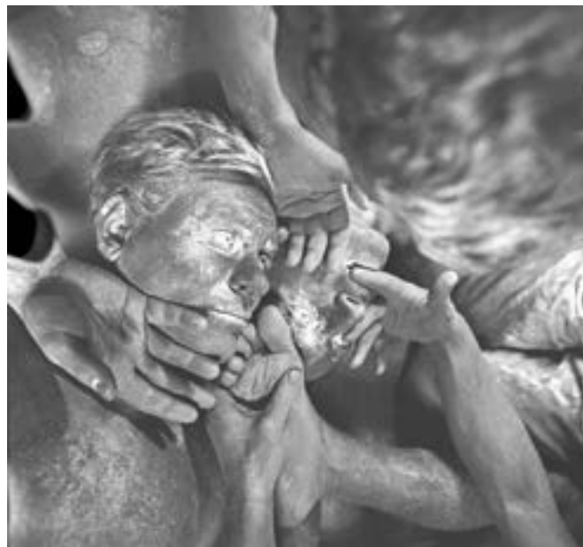
Il. 10. Ciała aktorów zabarwione na czarno na potrzeby negatywowej sceny wizyjnej filmu Ręce do góry

Zmiany dotyczą zresztą także pozostałych retrospekcji. Pierwsza z nich została przemontowana – w wersji z 1981 r. rozpoczyna się od „zderzenia”