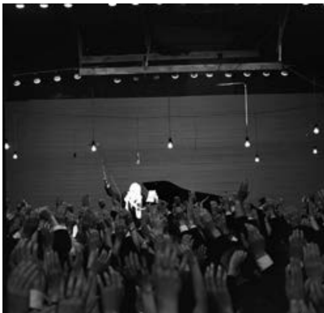
Il. 1. Sala balowa w filmie Ręce do góry

Część eksplikacyjna jest intrygująca z uwagi na opisane „pomysły, których realizacja nie zawsze udaje się w tej formie, w jakiej zostają zanotowane” 16 . Dotyczą one przestrzeni filmowej Rąk do góry . Pisze Skolimowski: „wagon powinien mieć zmienny kształt w zależności od subiektywizacji spojrzenia i napięcia emocjonalnego sceny – czasem zwęży się, tworząc niekończący się korytarz, czasem rozrasta się do rozmiarów sali balowej, czasem zacieśnia się do rozmiarów komórki, w której z trudem mieszczą się bohaterowie” 17 . W nakręconym filmie (także w wersji okrojonej) idea ta została częściowo zrealizowana pod koniec sekwencji „wagonowej”. Drugi z pomysłów – ten nie pojawia się w żadnej z wersji nakręconego filmu – dotyczy sceny miłosnej, „w tańcu na lodzie, ale nie pokazując, iż bohaterowie poruszają się na łyżwach – byłoby to niedostrzegalne przejście montażowe z dekoracji na lodowisko z fragmentem ściany wagonu w tle i równie niedostrzegalny powrót dekoracji” 18 .