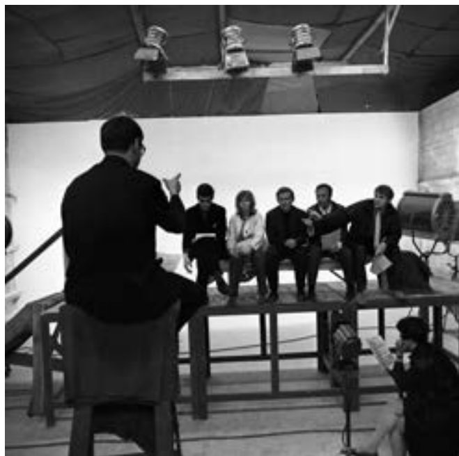
Il. 7 Aktorzy podczas realizacji sceny przesłuchania – werk z filmu Ręce do góry