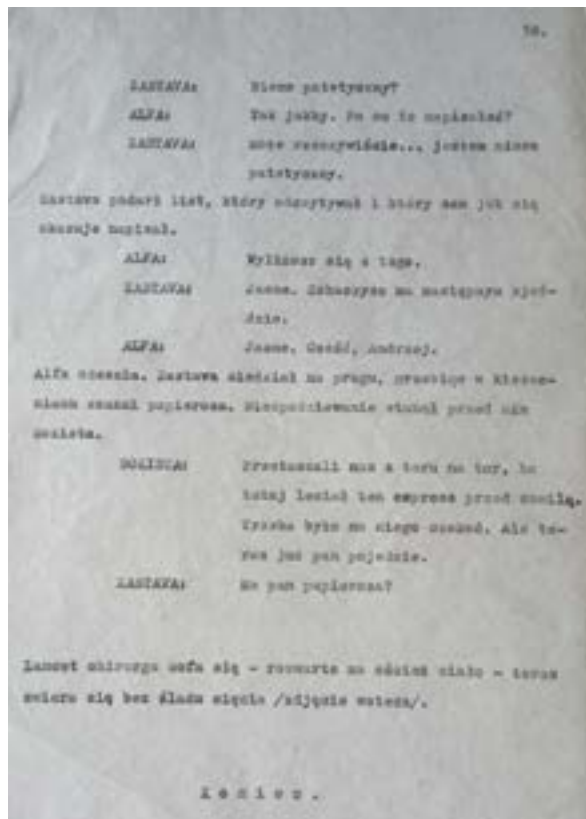
Il. 3. Ostatnia strona scenariusza Ręce do góry z 1966 r.

Fragmety tej wersji scenariusza zostały przedrukowane w „Ekranie” (w numerze z czerwca 1967 r., a zatem w czasie, gdy trwały zdjęcia do filmu); materiał ten zawiera także kilka fragmentów storyboardu 22 . Można się więc przekonać, że w porównaniu z nakręconym materiałem istotna zmiana dotyczy imion (pseudonimów) protagonistów. Bohater zagrany w filmie przez Bogumiła Kobięłę zwie się w scenariuszu Rekord, natomiast postać grana przez Adama Hanuszkiewicza w scenariuszu to Trabant (i to ten bohater jest weterynarzem); nie ma też informacji o tym, iż jest małżonkiem Alfę. Bardziej rozbudowane są natomiast sugestie dotyczące dawnej relacji Alfę i Zastawy (w scenariuszu zapis z „v”). Gdy wchodzi do wagonu, bohater obejmuje Alfę za kolana, „przez chwile trwają w tym zbliżeniu, Alfa delikatnie dotyka włosów Zastawy” 23 . Niedługo potem bohater domaga się od kolegów zwrotu 500 złotych długu; gdy Alfa chce się dołożyć, Zastawa oponuje: „Chyba wciąż jeszcze ja ci jestem winien” 24 (w scenopisie wątek ten przybierze postać banknotu 500-złotowego, który w partii retrospekcyjnej Zastawa podrze na dwie części, przekazując jedną z nich Alfę). Z drugiej strony, w scenariuszu Alfa nie jest – jak w filmie – indagowana o dzieci; brak też informacji o zabiegu chirurgicznym, jaki w okolicach jej podbrzusza wykonał Rekord (być może obie informacje należy ze sobą logicznie powiązać).