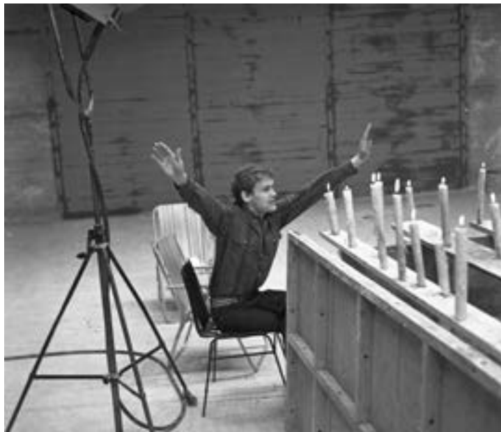
Il. 5. Jerzy Skolimowski reżyseruje Ręce do góry . Autor: Jerzy Troszczyński (prawa: WFDiF, źródło: Fototeka FINA)

Dysponujemy dwoma zapisami pochodzącymi z połowy 1967 r. dającymi częściowy wgląd w okres zdjęciowy filmu 90 . Pierwszym jest przywołany już reportaż Krystyny Garbień z „Filmu” 91 . Wynika zeń, że w toku zdjęć (a zatem po złożeniu scenopisu) pseudonimy bohaterów nie zostały jeszcze ustalone; reportaż zawiera też fotos z czwartej retrospekcji (próby samobójczej), a zatem tej nieobecnej w scenopisie. Drugim źródłem jest materiał z planu zdjęciowego, który ukazał się w „Polskiej Kronice Filmowej” 92 (zawiera on m.in. fragmenty sceny dialogowej, która nie weszła do wersji filmowej 93 ). Fakt, że zdjęcia do filmu trafiły do PKF potwierdza, że projekt Skolimowskiego budził zainteresowanie (reżyser wspominał, że plan zdjęciowy, zaaranżowany w hali tenisowej klubu sportowego „Sarmata” na Woli, był swego rodzaju atrakcją towarzyską – „Hala na Wolskiej stała się jakby Mekką, odwiedzali nas wszyscy” 94 ).