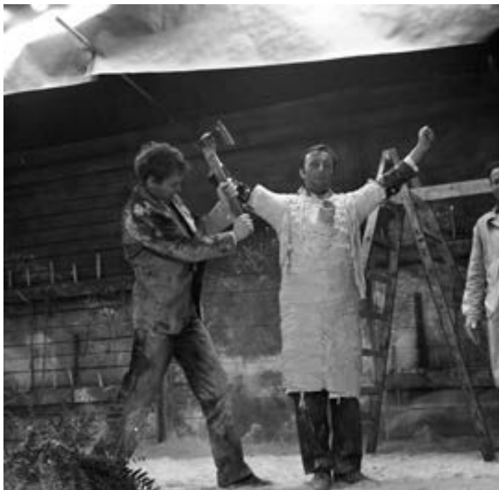
Il. 2. Nie skalpelem, lecz siekierą. Werk z filmu Ręce do góry

Gdy natomiast idzie o sekwencję „wagonową”, do filmu przeniesiono wymowę ideową poszczególnych sekwencji i główne koncepty dramaturgiczne. Identyczny jest cel wyprawy (wywołanej listem rzekomego kolegi z prowincji), rozbudowany wątek zagipsowania najbardziej nietrzeźwego i nieco agresywnego pasażera, następnie: swoiste curriculum vitae każdego z balangowiczów (w scenariuszu nie ma jeszcze pomysłu „pigułki prawdy”), wreszcie – ni to zabawa, ni to psychoza spowodowana przez przyrównanie sytuacji pasażerów do transportu więźniów z lat II wojny światowej, zwieńczona odkryciem, że wagon cały czas stał na bocznicu.