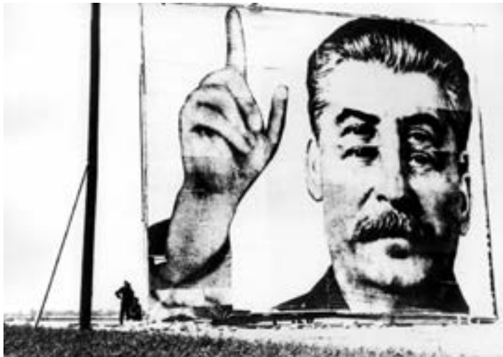
Il. 4. Ekipa podnosi plakat na planie zdjęciowym/ Werk z filmu Ręce do góry

portret Stalina, jako najbardziej uniwersalny, nie wymagający komentarzy – których właśnie należałoby tu uniknąć. Żadnych dodatkowych aluzji politycznych, żadnych przy okazji „rozrachunków” – ot, tylko zdarzenie – jakże typowe dla tamtych lat. Dzięki temu uzyskujemy skrótową oprawę czasową i plastyczną dla tej retrospektywnej anegdoty, opowiedzianej bardzo dyskretnie, poważnie i taktownie 83 .